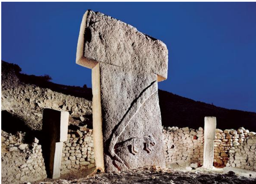
Illustration 2 : le Grand T

L'image dans l'article nous dit tout sur ce changement vers un cadre de conscience dualiste à travers le symbole d'une pierre en forme de T érigée à l'image de l'Arbre du Monde.* Il faudrait aussi se rappeler que les inscriptions mayas disent explicitement que le début du Compte Long fut établi par « l'érection de l'Arbre du Monde » afin que « la lumière puisse entrer ». Ce que nous voyons à Göbekli Tepe (en Turquie) en est donc un signe avant-coureur et nous avons des raisons de croire que les gens qui érigèrent ce site avaient exactement le même sens de résonance avec l'Arbre de Vie que les Mayas, quoique pour la pré-onde de l'histoire. Le T de la pierre âgée de 11000 ans présageait les symboles ultérieurs de l'Arbre du Monde et la croix qui plus tard allaient se répandre partout avec la 6 e onde. Comme nous le savons maintenant, c'est la polarité yin/yang (émanant de l'Arbre de Vie) favorisant la partie gauche du cerveau qui créa la civilisation humaine qui débuta il y a 5100 ans. Il n'est pas si outrancier de considérer que les chasseurs et cueilleurs qui construisirent Göbekli Tepe avaient « mis en place » une « Convergence dualiste » en l'honneur de l'Arbre du Monde, annonçant la nouvelle conscience à venir, qu'ils en aient été conscients ou pas.