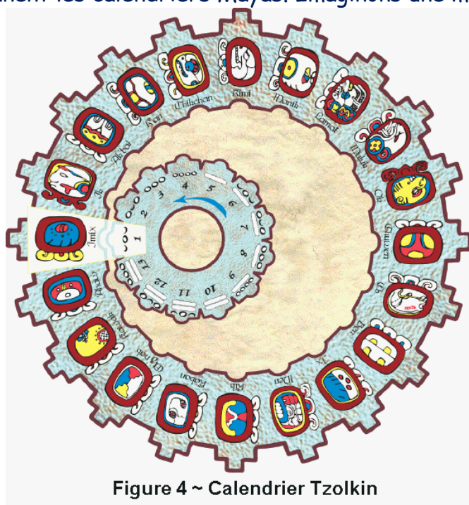
Figure 4 ~ Calendrier Tzolkin

Pour comprendre pourquoi cette date est importante, nous devons saisir comment fonctionnent les calendriers Mayas. Imaginons une montre mécanique.