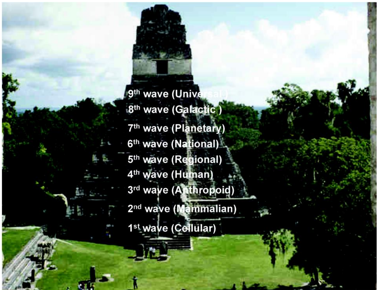
Fig 1. Piramida Cosmică sau zeul cu noua trepte (Bolon Yookte), ale cărui nouă nivele se vor manifesta simultan, când Calendarul Mayas ajunge la sfârșit

Multe persoane au intuit că sfârșitul calendarului Mayas va aduce o schimbare totală în conștiință . Cu toate acestea, foarte rar se spune clar sau se explică exact care este sursa unei asemenea schimbări, cum se va întâmpla ea și care ar fi natura ei. Este foarte probabil că schimbările în conștiință să fie, în realitate, mai puțin misterioase decât cred mulți oameni. De fapt, schimbările în conștiință s-au întâmplat de la începutul timpurilor și continuă să se întâmple, ori de câte ori apare o modificare semnificativă de energie în calendarul Mayas – ca de exemplu, oricare dintre momentele ce marchează trecerile dintre Zilele și Noptile din calendar.